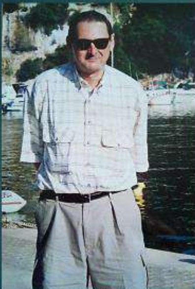
En una cala l'Àngel