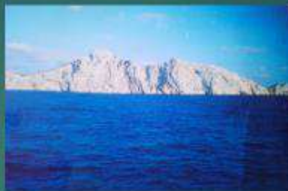
Arribant a Mallorca en Catamarà.