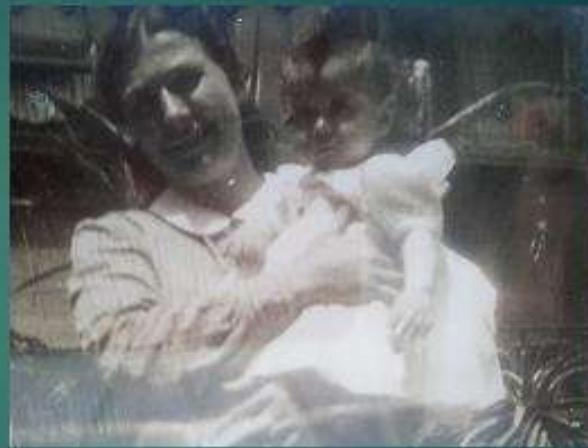
La dida als 8 mesos

Plegamans on vaig néixer el 30 d'agost del 1952, església encara sense el campanar. Era el regal núm. 8 dels nostres pares. Era la festa major del poble.