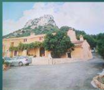
La casa rural on estàvem.