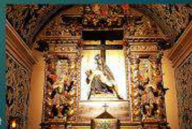
La Pietat al Monestir de Sant Cugat