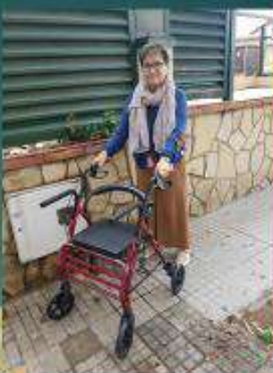
Caminador de carrer