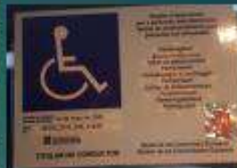
Targeta pel cotxe