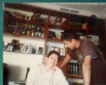
El meu suport fonamental