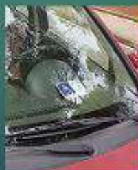
Signe invàlid cotxe